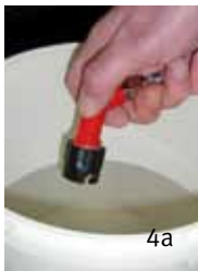
Abb. rechts: Reinigung des Zapfkopfes mittels Zapfkopfdusche

Abb. mittig: Reinigung des Zapfkopfes mittels Trinkwasser und Bürste