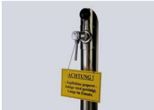
Abb. 8: Beispielhafter Warnhinweis

Achtung: Falls während der Reinigung die Entnahme von Reinigungsmitteln über die Zapfarmatur möglich ist, muss an dieser Stelle ein geeigneter Warnhinweis für die Dauer der Reinigung angebracht sein (Abb. 8).