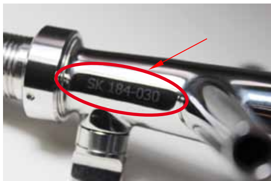
Abb. 1: Beispielhafte Schankarmatur (hier: Zapfhahn) mit SK-Kennzeichnung

Hinweis: Wenn Sie Bauteile ohne SK-Kennzeichnung verwenden, müssen für die Überprüfung der Getränkeschankanlage entsprechende Herstellerbescheinigungen (z. B. Konformitätserklärung, Bestätigung der lebensmittelrechtlichen Unbedenklichkeit) vor Ort vorliegen.