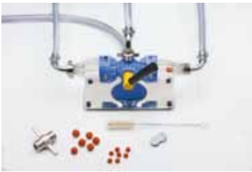
Abb. 11: Beispielhaftes Reinigungsgerät mit Schwammkugeln und Reinigungstablette zur chemischen Reinigung

Jede Schwammkugel darf nur einmal benutzt werden, da sich in den Poren der Kugeln Mikroorganismen sammeln.